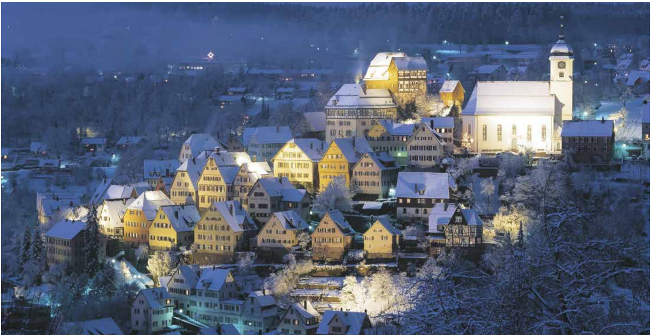
Das Markenzeichen der Stadt Altensteig, die steil aufragende Altstadt, bildet den Rahmen für den Weihnachtsmarkt – eine passendere Szenerie kann es dafür kaum geben.

Wieder Tausende Besucherinnen und Besucher von 1. bis 3. Dezember in der historischen Altstadt erwartet