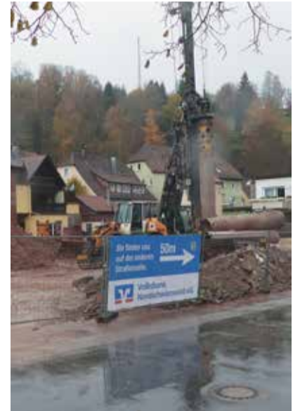
Raum für Neues: Die Volksbank Nordschwarzwald hat ihre Altensteiger Filiale in der Rosenstraße abgerissen. An der selben Stelle soll bis im kommenden Herbst ein Neubau entstehen, in den die Volksbank dann wieder einzieht. Bis dahin sind die Mitarbeiter in einer Containerbank schräg gegenüber auf dem eigentlichen Mitarbeiterparkplatz zu erreichen.