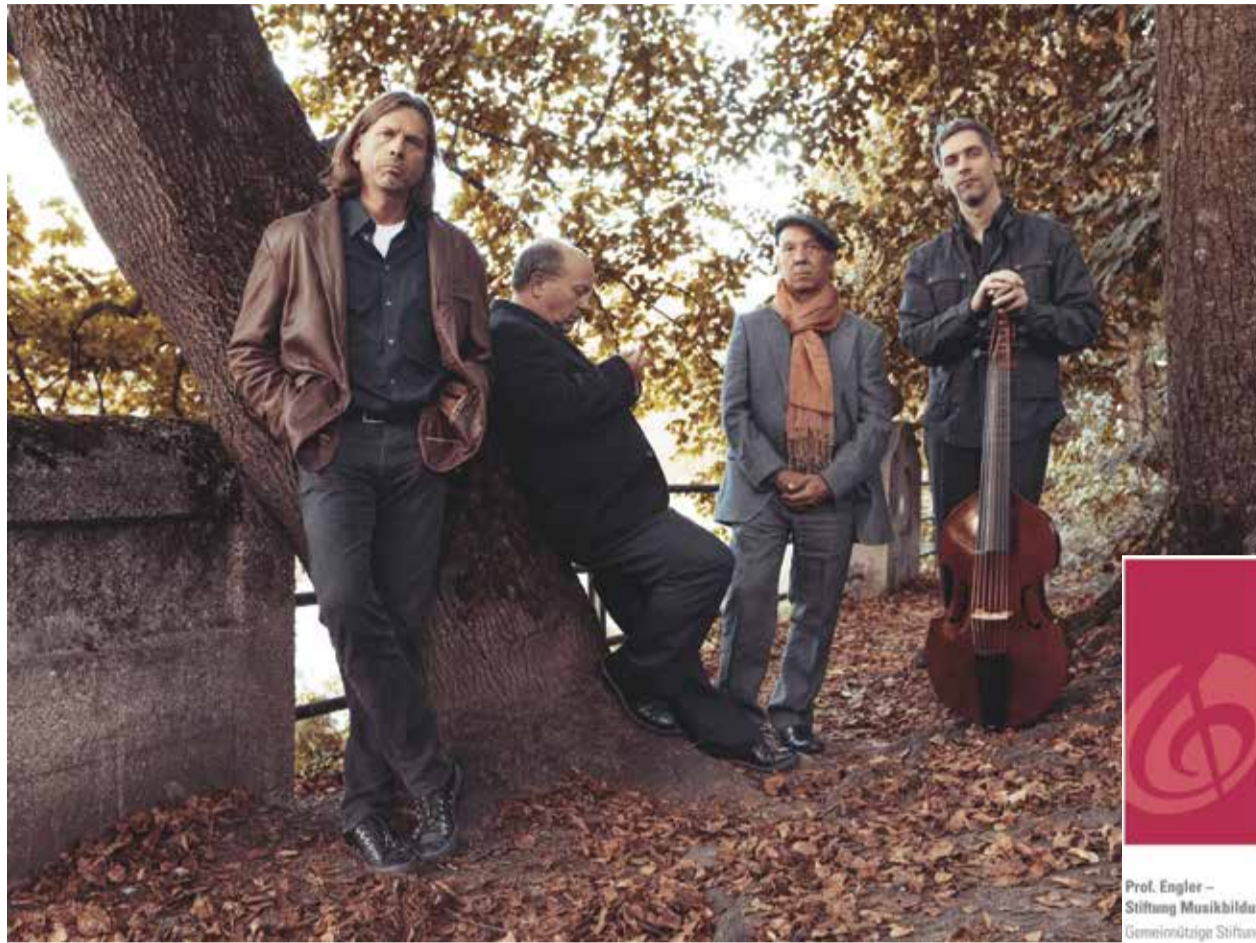
Die Programme des Ensemble Phoenix Munich zeigen dessen zwei Lieben: die Musik des mittel- und nordamerikanischen Kontinents und die Musik der europäischen Renaissance.