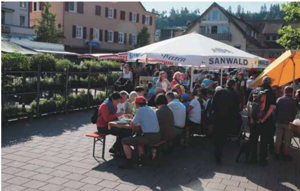
Der „Herbstzauber“ am 18. November wird das einzige Marktfrühstück des Jahres, bei dem im Stehen gegessen wird.

Letztes Marktfrühstück des Jahres am 18. November