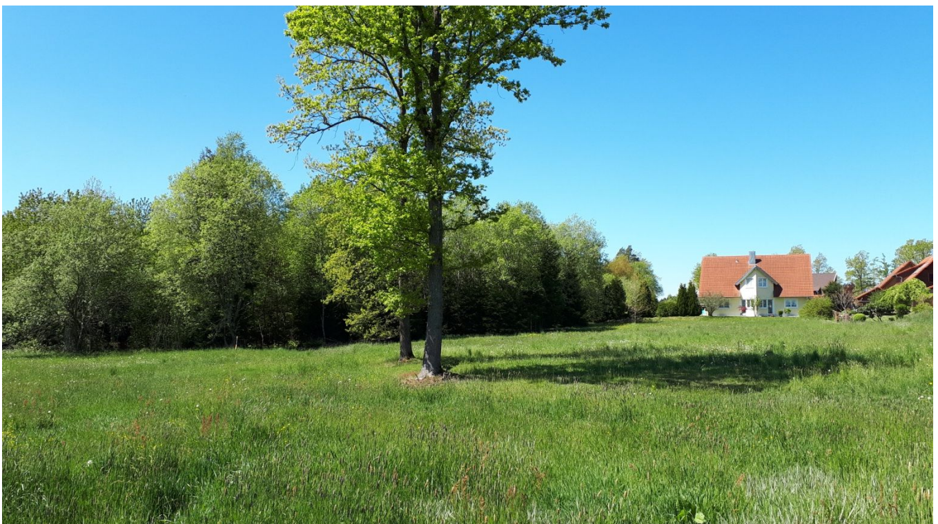
Blick von Osten

Der Geltungsbereich umfasst insgesamt 2,91 ha. Der Mischwald im Süden, einschließlich der als Wiesenflächen genutzten ehemaligen Waldbereiche im Nordosten nimmt dabei 2,75 ha ein. Die Rasenflächen der sechs Flurstücke 279/20 bis 279/25 südlich des Teuchelwegs sind 0,14 ha groß, die beiden Wege in Verlängerung der Straßen »Im Rehgrund« und »Karl-Hald-Weg« umfassen 0,02 ha.