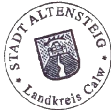
Gerhard Feeß Bürgermeister